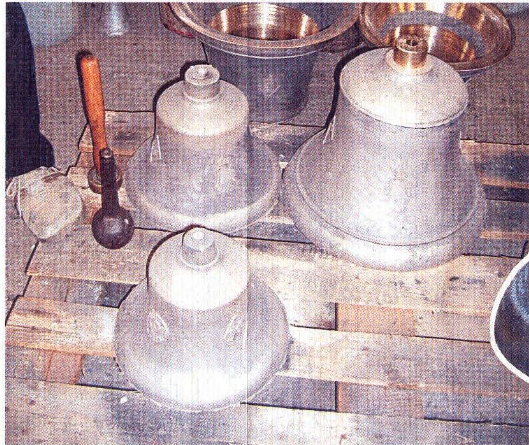
Der Guss der mit 375 Kilogramm größten und schwersten Carillon-Glocke klappte auf Anhieb

Auch einige der kleineren Glocken sind schon fertiggestellt. Diese Exemplare werden allerdings im technisch einfacheren